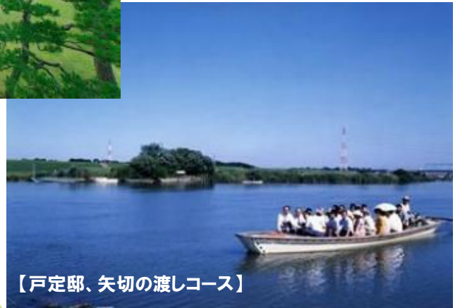
【戸定邸、矢切の渡しコース】