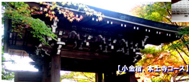
【小金宿、本土寺コース】